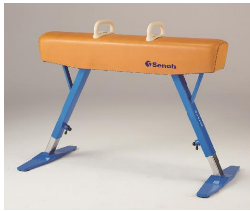
↑貴重な 1964 年当時の鞍馬も実物を展示。会期後半は最新の鞍馬に入れ替え。 どこがどのように違うのか、約 60 年にわたる道具の進化を是非ご実感ください。