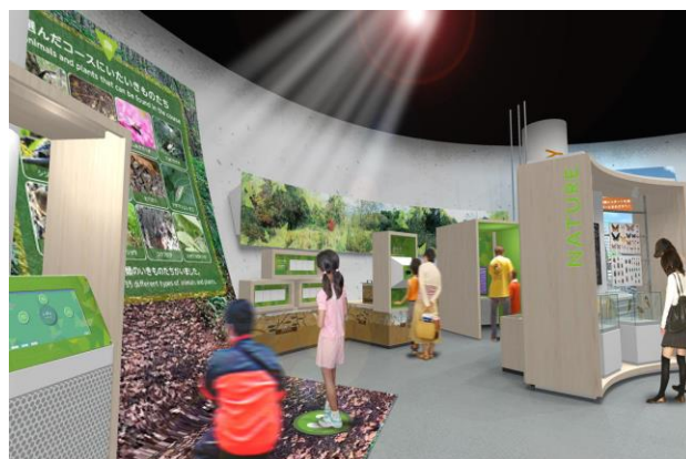
常設展示コーナー「しぜん」