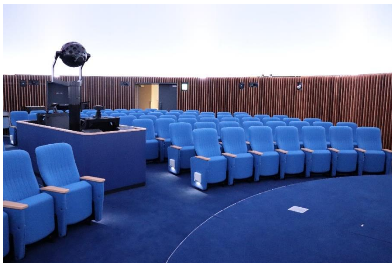
プラネタリウムホール