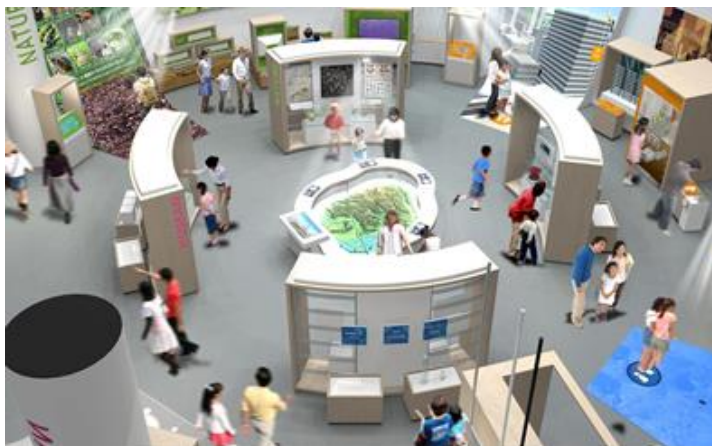
常設展示コーナーのイメージ

港区立みなと科学館（所在地：港区虎ノ門 館長：布施直人）は、令和2年6月15日、全館オープンいたしました。当初、令和2年4月1日の開館を予定しておりましたが、新型コロナウイルス感染拡大防止のため開館を延期。その後、6月1日より常設展示コーナー・多目的ロビーを開放して参りましたが、プラネタリウムは感染拡大防止策を施し、本日から運用を開始いたしました。