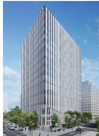
建物全景：みなと科学館は、同建物の1、2階部分

港区は、歴史と国際性が豊かな都市であり、先端的な研究や様々な技術を持つ企業が集積しています。みなと科学館では、この特徴を活かして、子どもたちをはじめとする人々を対象として、世界で活躍していく人材を、活動を通じて輩出していきたいと考えています。そのため、区の理科教育の体験学習機能だけでなく、都会の真ん中で科学や技術をテーマとした新しいコミュニケーションの場として科学館を運営します。みなと科学館を区民の誇る「知の拠点」とし、地域の人々と共に科学体験や文化活動を行います。この交流によるさらなる地域活性化にも関わり、地域ブランドを高める活動へ繋げることに取り組みます。